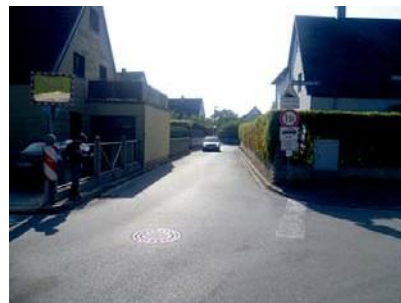
2.4 Kreuzung Peter-Parler-Str., Johann-Sebastian-Bach-Str. und Balthasar-