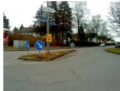
2.3 Abknickende Vorfahrtsstr. Mozart-Str., Franz-Schubert-Str. und Franz-Liszt-Str.