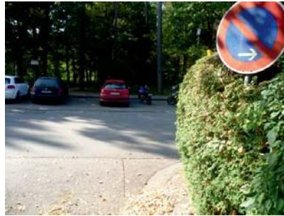
2.1 Ecke Lincke-Weg und Franz-Schubert-Str.