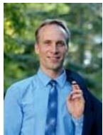
Robert Pöttsch Erster Bürgermeister

Für die Mitwirkung an der Erstellung dieses Planes möchten wir uns beim Gymnasium Waldkraiburg bedanken, die ihn im Rahmen einer Projektarbeit ausgearbeitet haben. Die Stadt Waldkraiburg sowie Ihre Schule und die Elternbeiräte wünschen allen Schulkindern, dass ihnen nichts passiert.