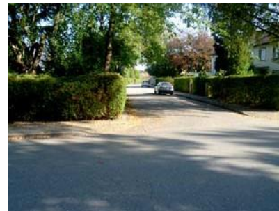
2.2 Ecke Lehar-Weg und Franz-Schubert-Str.